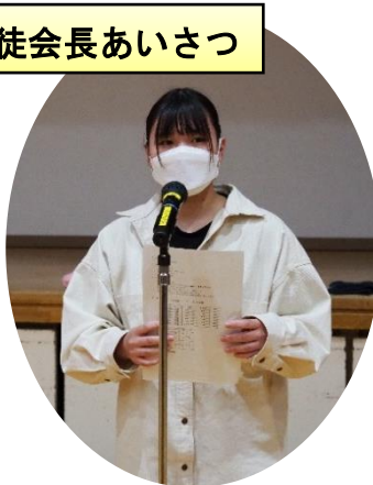
生徒会長あいさつ