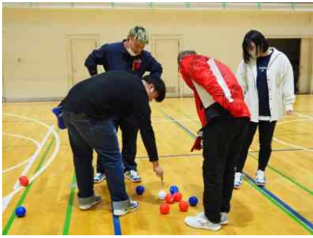
↑はさみのような 計測器具