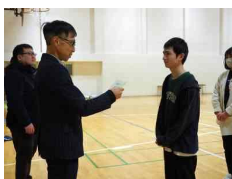
2位トーナメント1位