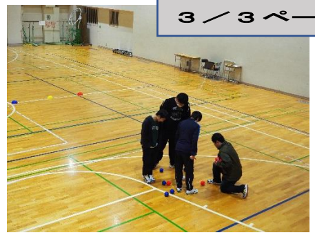
↑どちらが近いかな？